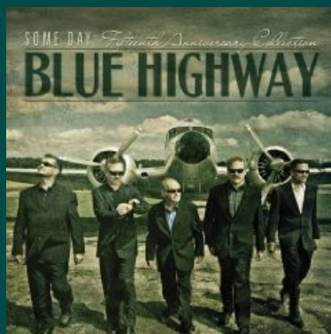
Blue Highway - Some Day: The Fifteenth Anniversary Collection