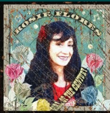
Rosie Flores - Girl Of The Century