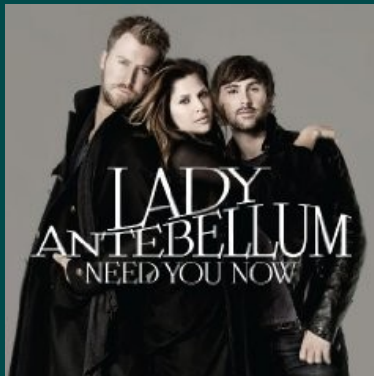
Lady Antebellum - Need You Now