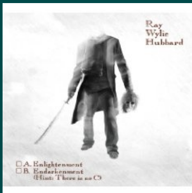
Ray Wylie Hubbard - A. Enlightenment B. Endarkenment